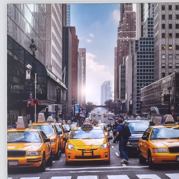
80 x 80 cm