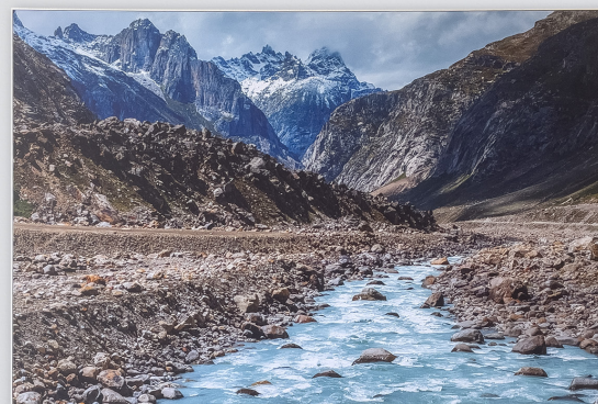
120 x 80 cm